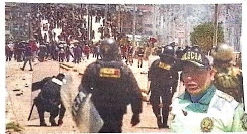
Jefe de la Macrepol sobre protestas en diciembre.

Asimismo, indicó que la Policía Nacional ya tiene un plan de trabajo desde que asumió el cargo en el mes de marzo, esto para manejar las protestas, por lo cual reiteró que se garantizará la libertad de expresión y