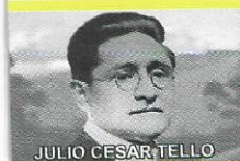
JULIO CESAR TELLO