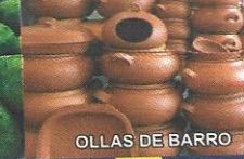
OLLAS DE BARRO