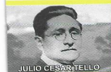
JULIO CESAR TELLO