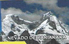
NEVADO DE PARIAKAKA