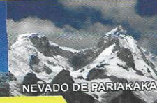
NEVADO DE PARIAKAKA