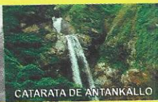
CATARATA DE ANTANKALLO