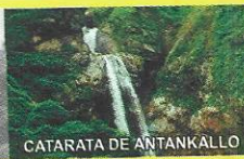
CATARATA DE ANTANKALLO