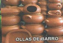
OLLAS DE BARRO