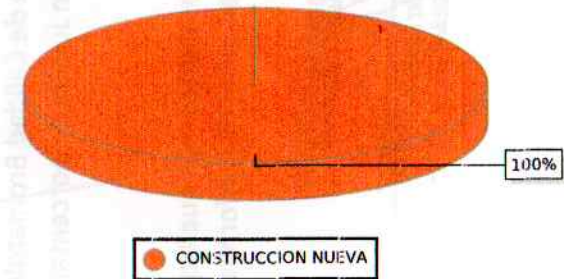
PROYECTOS POR TIPO DE INTERVENCION