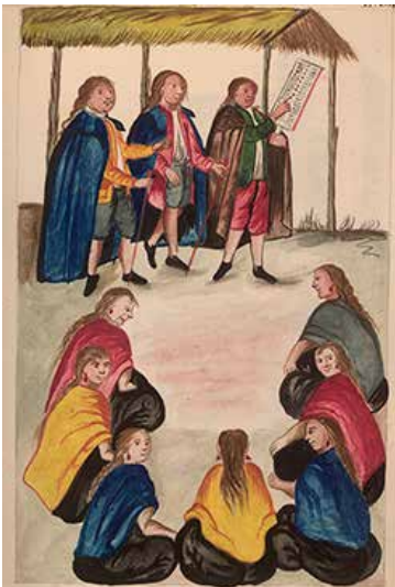
Padrón de viudas