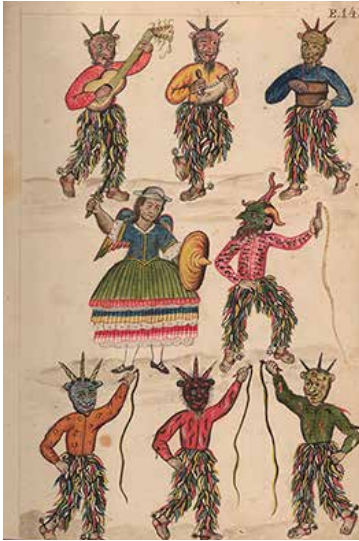
Danza de los diablos