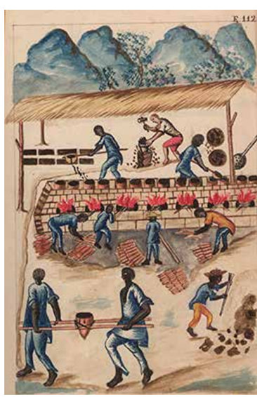
Recojo de brea