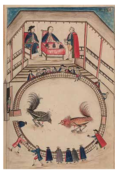
Pelea de gallos