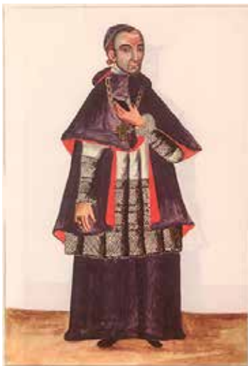
Obispo Baltazar Martínez Compañón

En 1790, el obispo Martínez Compañón dejó Trujillo para asumir el Arzobispado de Bogotá. Nueve años más tarde, cuando advirtió que las fuerzas flaqueaban, dispuso que el códex le fuera remitido al rey Carlos IV, a quien había enviado en un par de ocasiones una serie de cajas con ceramios prehispánicos y otras curiosidades «halladas en las huacas de los indios gentiles». El primero de los nueve tomos contiene mapas, planos y retratos de funcionarios, obispos de Trujillo y religiosos de las diversas órdenes allí establecidas. El segundo recopila, sobre todo, escenas domésticas y costumbristas de españoles, mestizos, indígenas y afroperuanos. Los tres tomos siguientes se refieren al reino vegetal, el sexto está dedicado a la fauna terrestre, el séptimo a las aves, el oct-