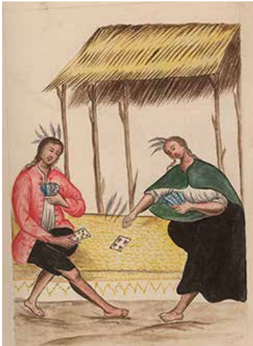
Juego de naipes