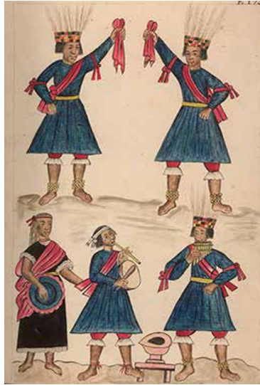
Danza de la montaña