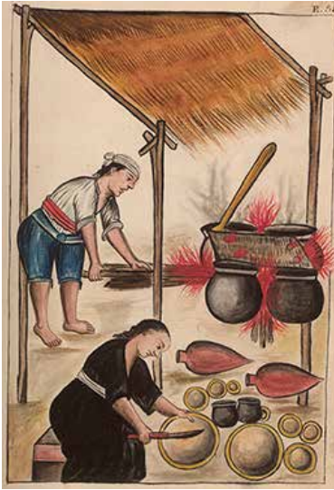
Preparación de la chicha