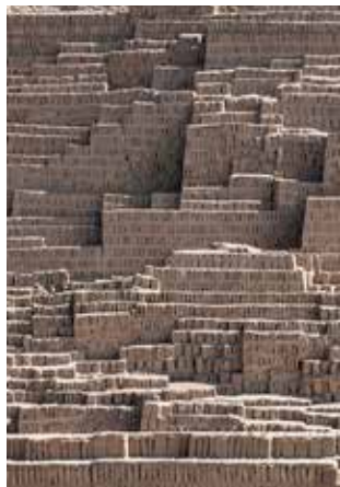
Huaca Pucllana.

Se pidió opinión sobre el listado resultante a algunos de los urbanistas, historiadores y arquitectos, de distintas corrientes ideológicas, que por una u otra razón han tenido un papel en la construcción de la ciudad. Los entrevistados se detenían en los temas que conocían aportando nuevas ideas y matices. A veces echaban en falta alguna obra o se sorprendían por la presencia de otras. Una vez reducida la selección a 200 edificios, se org-