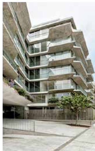
Edificio Alcanfores.

En el libro también están presentes, de manera indirecta, aquellos académicos que han contado su historia con más interés, explicando el papel que la infraestructura hidráulica tuvo en el desarrollo de los asentamientos de la costa -Ruth Shady-, describiendo qué pasa cuando un estado se ve desbordado por una realidad social emergente -José Matos Mar-, o revelando la actividad comercial que hay detrás de la informalidad -Hernando de Soto-.