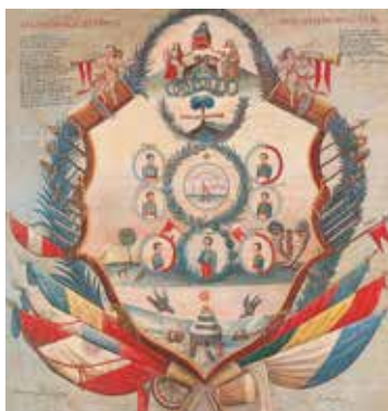
S. Juárez. Bolívar en el Cuzco, 1825