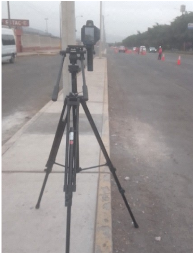
ILUSTRACIÓN DEL MEDIDOR DE VELOCIDAD PORTÁTIL CON NÚMERO DE SERIE TC010521