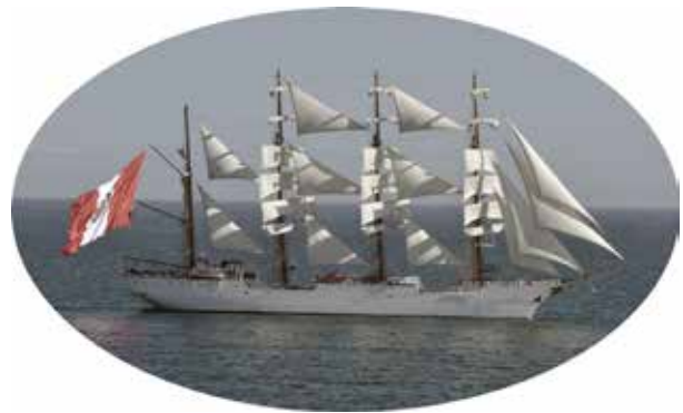
BAP Unión, 2024

En esa tierra llana muy poblada dieron algunas calas para tomar posesión y proveerse de agua. Tomaron un navío en que venían hasta veinte hombres, en que se echaron al agua once de ellos, y tomados los otros dejó en sí el piloto tres de ellos, y los otros echólos así mismo en tierra para que se fuesen; estos tres quedaron para lenguas, hízoles muy buen tratamiento y trájelos