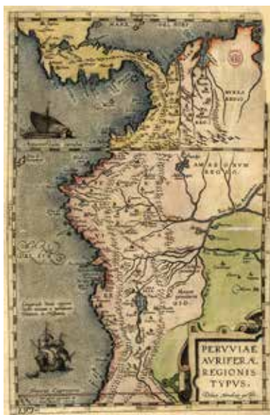
Diego Méndez. Peruviae Aurifera Regionis Typus , Amberes, 1584

Los dichos capitanes teniendo noticia de una provincia que se dice el Perú {...}, partieron {...} con dos navíos de cuarenta y setenta toneles y un bergantín pequeño, y hasta 150 hombres, compañeros de tierra, y sus maestros y marineros, que discurriendo por la costa hasta dar en la dicha provincia; y hallaron algunos pueblos junto a la mar, pequeños, y con algunos de ellos asentaban sus paces y pasaban