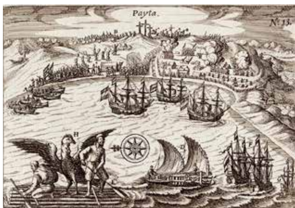
Joris van Spilbergen. Payta , s. XVII

habían dejado en la costa los hallaron quemados y los indios alzados e idos la tierra dentro; parece que aquellos pueblos solos se sirven los indios de pesquerías y hacer sal para proveer los otros de tierra dentro. Procuraron de entrar los capitanes y gente de un pueblo que no tuvieron noticia, que era grande y bueno y dieron sobre el; halláranle barreado todo de madera y rama. Al combatir, fueron heridos algunos cristianos y quebraron el ojo al capitán Diego de Almagro. Las armas que tenían eran lanzas y tiraderas y macanas y piedras; al fin entraron el pueblo e hirieron y mataron algunos indios; ellos tenían alzada toda la hacienda mujeres e hijos, y los capitanes por curar los enfermos, tornáronse al navío. Y porque la tierra era muy áspera de ciénagas y muy untuosa, por toda aquella costa la dicha provincia, que es hasta ochenta leguas, aunque es la costa llana para la tierra dentro, no se mandan por camino ninguno, salvo