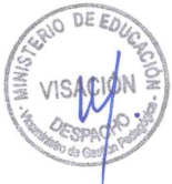
..... EDUARDO MELCHOR ARANA YSA Ministro de Justicia y Derechos Humanos