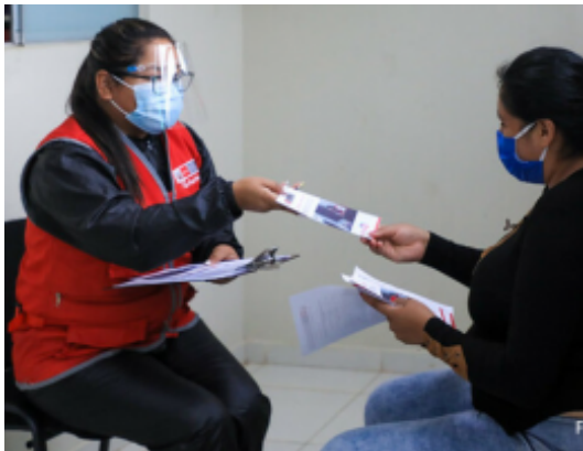
MIMP aprueba la Estrategia Nacional de Prevención de la Violencia de Género "Mujeres libres de violencia"