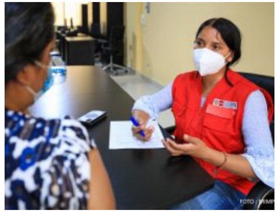
Estado peruano fortalece la interoperabilidad en el Sistema nacional especializado de justicia