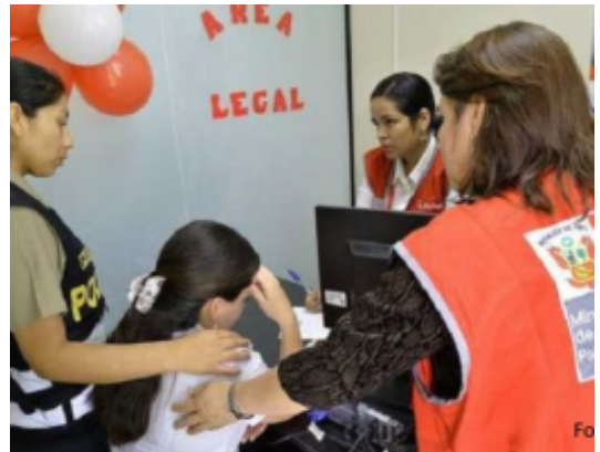
Modifican el Reglamento de la Ley para prevenir, sancionar y erradicar la violencia contra las mujeres y los integrantes del grupo familiar