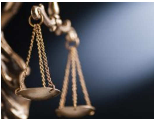
Aprueban norma que fortalecerá el Sistema nacional especializado de