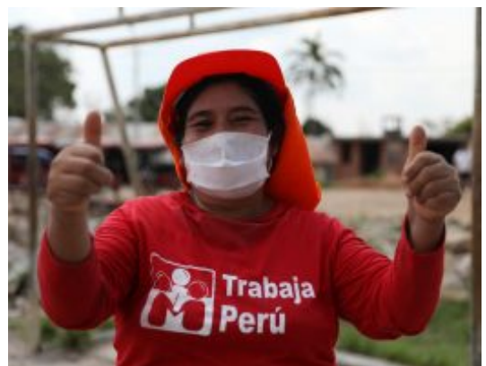
Aprueban reglamento de Ley que promueve la inserción laboral de mujeres