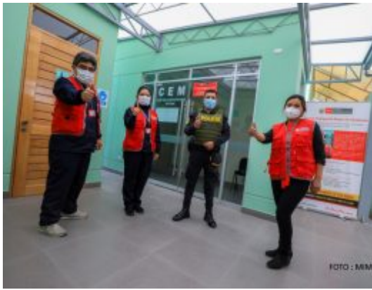
Se modifica el Reglamento de la Ley de Prevención y Sanción del Hostigamiento Sexual