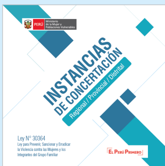
Rol de las Instancias de Concertación a nivel regional, provincial y distrital.