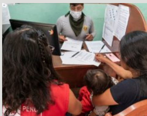
Pronunciamiento de la Comisión Multisectorial de Alto Nivel (CMAN) de la Ley N° 30364.