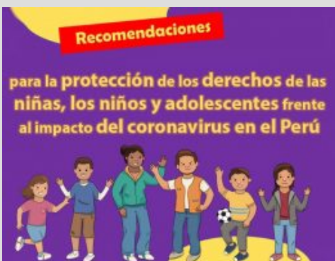
Medidas para proteger a la niñez y adolescencia en la pandemia COVID-19.