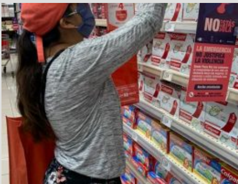
'No estás sola' una iniciativa público privada para prevenir la violencia en la Emergencia Sanitaria.