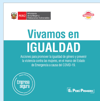
Acciones de las personas jurídicas en el marco del Estado de Emergencia a causa del COVID-19.