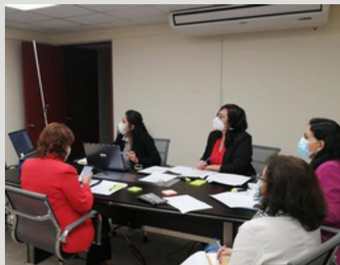
Comisión Multisectorial de Alto Nivel reforzará respuesta de los servicios de justicia para proteger a la víctimas de violencia.