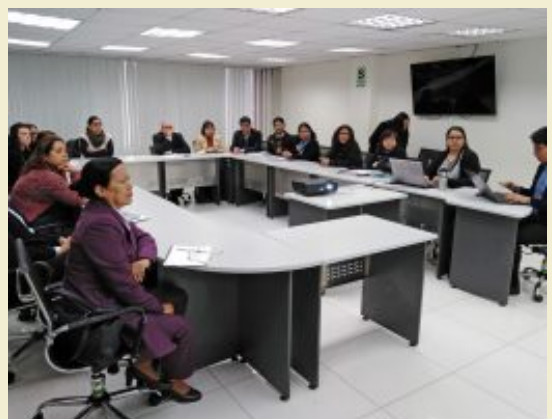
El GTN se fortalece como instancia de seguimiento de la política contra la violencia de género