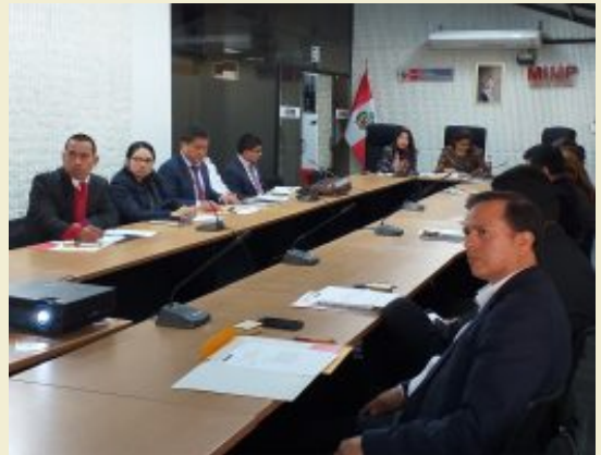
Consejo Directivo del Observatorio Nacional conforma subcomisión de trabajo