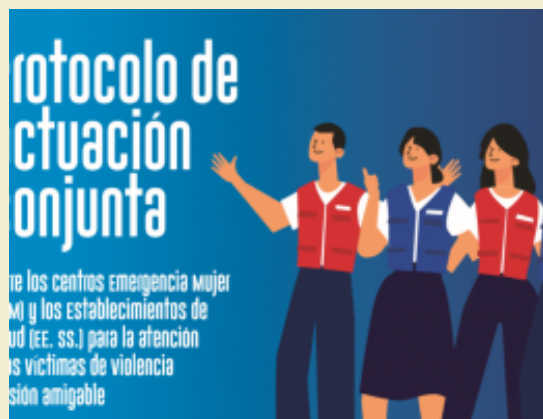
Protocolo de actuación conjunta CEM y Establecimientos de salud