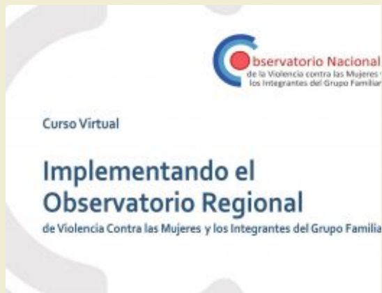
Culminó el curso virtual para implementar Observatorios Regionales