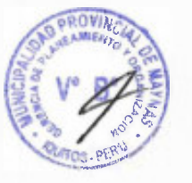
Modelo de Foliación (Referencial)