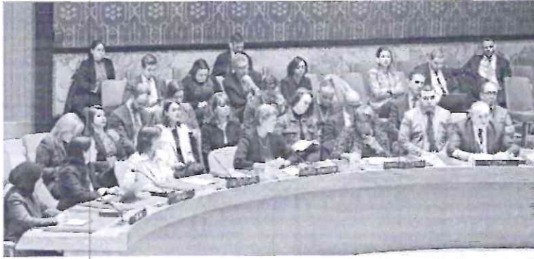
FRENO PARA LA PAZ. Dicha decisión ha sido altamente criticada por la comunidad internacional.