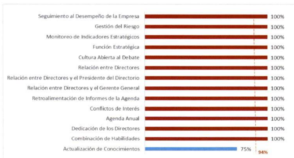
Gráfico N° 3: Autoevaluación de Directores - Resultados por elemento

94%: Promedio obtenido a nivel de todas las empresas participantes para la Autoevaluación de Directores.