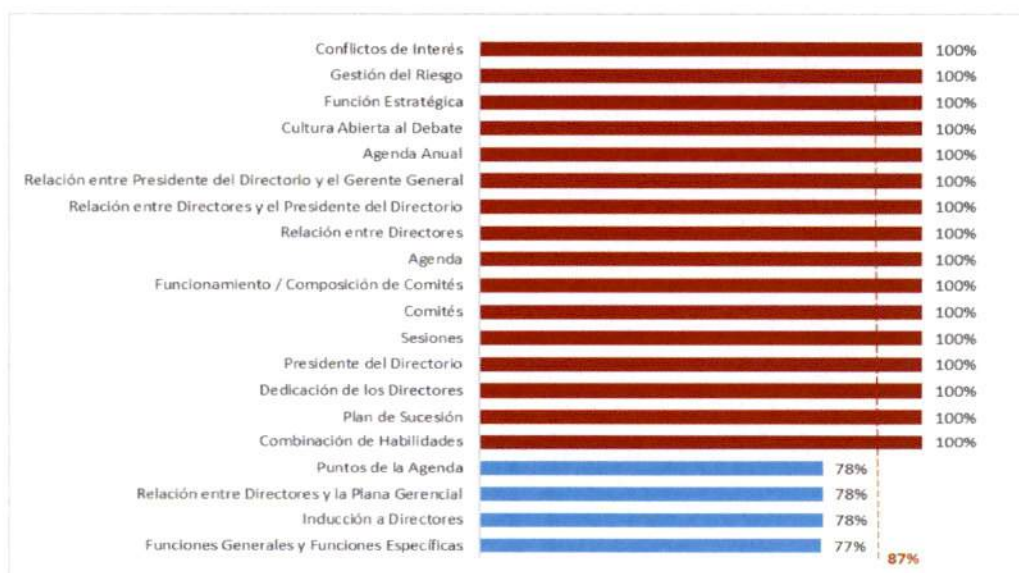
Gráfico N° 1: Autoevaluación del Directorio - Resultados por elemento

87%: Promedio obtenido a nivel de todas las empresas participantes para la Autoevaluación del Directorio.