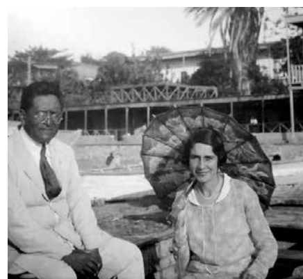
Con Julio C. Tello