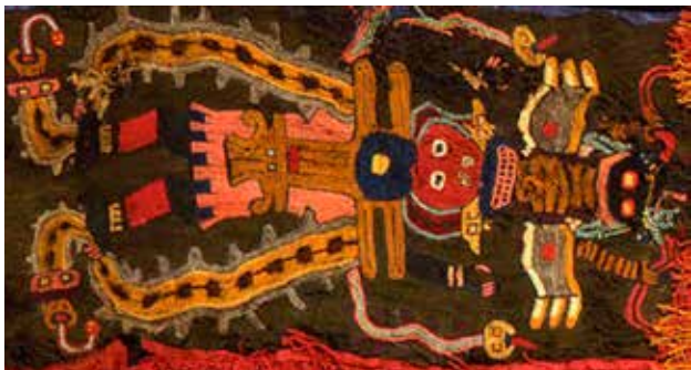
Manto Paracas (detalle)

Más adelante siguió con las excavaciones del centro funerario de Ancón, donde tuvo que soportar los mismos problemas derivados de su condición de mujer, y debió, incluso, enfrentarse, al igual que Tello en su momento, a los inescrupulosos constructores, que deseaban arrasar los vestigios que se encontraban en la zona para avanzar con las obras de edificación del balneario. Rebeca Carrión siempre destacó en los diversos congresos de americanistas en los que participó, presentando ponencias en las que exponía el resultado de sus investigaciones sobre las culturas peruanas ancestrales. «El culto al agua en el antiguo Perú» (1955) y «La religión en el antiguo Perú» (1959), fueron, por ejemplo, sus más importantes investigaciones sobre el pensamiento religioso del hombre andino precolombino, pues logra identificar a una serie jerárquica de divinidades encabezadas por el dios sol y la diosa luna, así como seres míticos antropomorfos, zoomorfos y fitomorfos. Realizó también diversas giras por universidades y museos de Europa y Estados Unidos, donde tomó contacto con conservadores de museos y renombrados arqueólogos. En Francia, recibió las «Palmas Académicas del Gobierno de Francia» por su importante labor como investigadora de la realidad peruana de la época inca y sus aportes al estudio de la historia y arqueología.