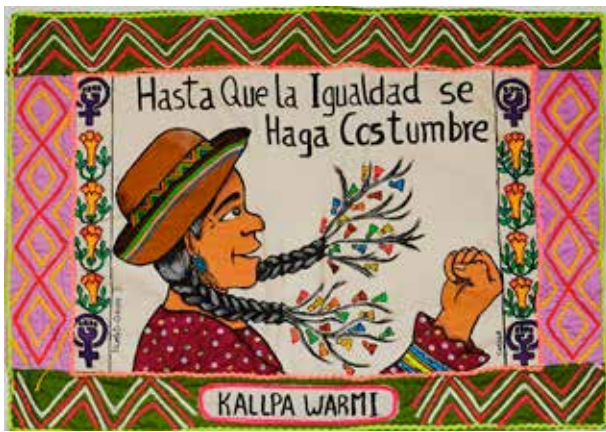
Violeta Quispe Yupari