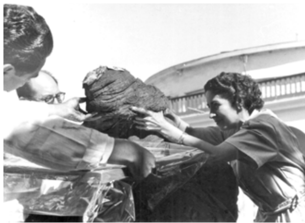
Desenfundando una momia