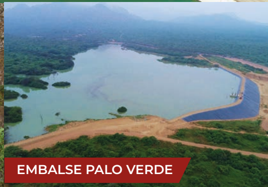
EMBALSE PALO VERDE