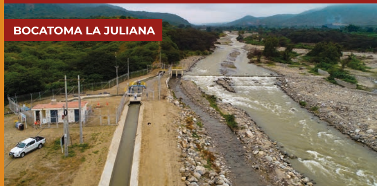
BOCATOMA LA JULIANA

Con el apoyo del Proyecto Especial Olmos Tinajones, a través de su Unidad de Gestión Social y Desarrollo Económico (UGESDE), se viene apoyando a los pequeños agricultores del Valle Viejo de Olmos, promoviendo la conformación de Asociaciones y Comités de Usuarios.