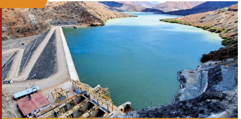
EMBALSE LIMÓN 45m

Consiste en el trasvase de las aguas del río Huancabamba, que son almacenadas en el Embalse Limón y conducidas a través del Túnel Trasandino, estructura principal de trasvase hacia el valle de Olmos, permitiendo el riego de 43,500 ha, mediante un moderno, presurizado y automatizado sistema de riego.