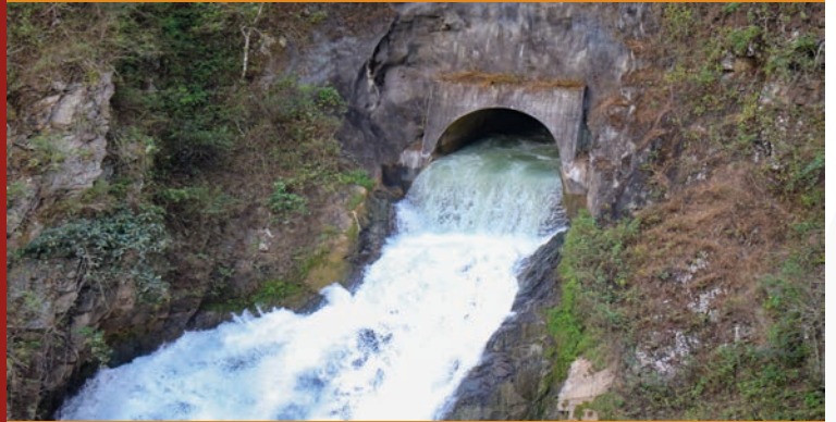
TÚNEL TRASANDINO 19.3 KM