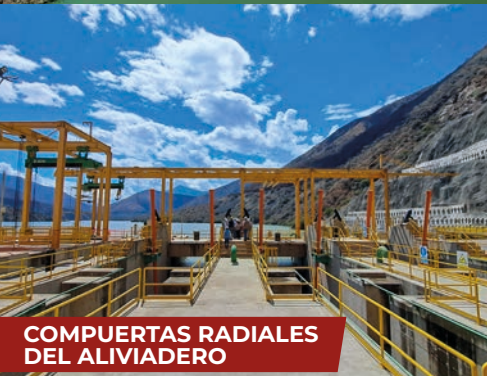
COMPUERTAS RADIALES DEL ALIVIADERO