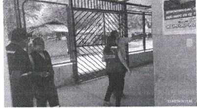
Recorrido dentro del Terminal Terrestre de Castilla, verificando que se cumplen con las condiciones técnicas señaladas por la autoridad competente.