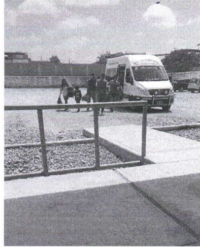
Ingreso de vehículos autorizados, controlado por el Terminal Terrestre para el Desembarque de pasajeros.