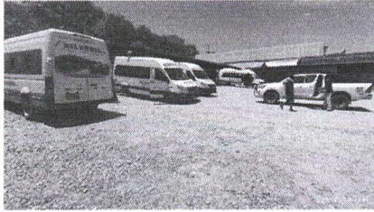
Área de Embarque de Pasajeros para vehículos de la Categoría M2