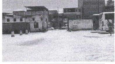
Puerta de Salida de Vehículos