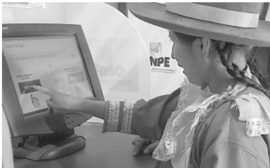
Campechina peruana experimenta con la máquina de sufragio electrónico.

voto a través de Internet. El sistema fue previamente probado en las elecciones de estudiantes en la Escuela Universitaria de Villanova.