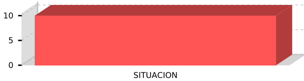
ESTUDIOS DE PREINVERSION