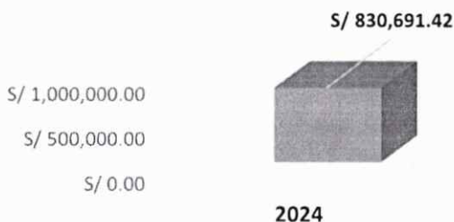
Predial desde el 12 de enero al 08 de marzo 2024

Que, se ha obtenido una recaudación, de 830,691.42 soles, desde el 12 de enero hasta el día 08 de marzo de 2024 de impuesto predial.