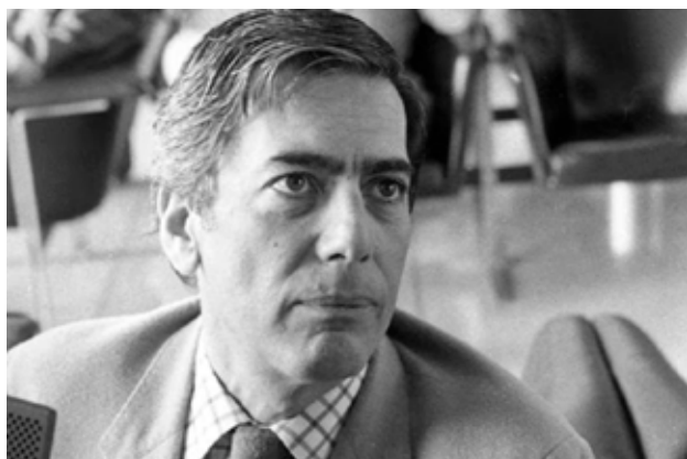
Vargas Llosa, años 80

«Nunca he dejado -escribió Vargas Llosa en su último artículo- de decir mi verdad, en la que hay un margen de error, a veces grande, y que puede ir evolucionando, incluso de manera drástica. Cuando he publicado compilaciones de artículos, como Contra viento y marea , donde se puede seguir mi trayectoria del socialismo al liberalismo en textos de hace muchos años, he querido que mis lectores asistan a través