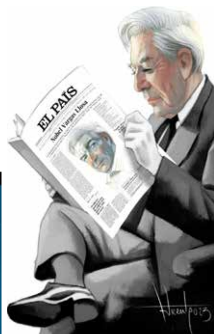
Libros recientes. Derecha: caricatura de Fernando Vicente. El País , 17/12/2023

«eterno aguafiestas», según afirmó en un famoso discurso de 1967, cuando recibió el Premio Rómulo Gallegos- ha roto lanzas en memorables ocasiones contra posturas anquilosadas o supuestas «correcciones políticas», y el tiempo ha terminado dándole la razón en muchos temas, aunque a veces su entusiasmo por determinados personajes públicos haya terminado en decepción. Dos batallas especialmente encomiables en su larga trayectoria de libre pensador en las últimas seis décadas: su defensa intransigente de las libertades y los derechos humanos y su firme alegato en favor del sistema democrático.