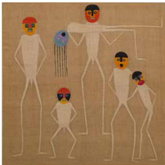
J. E. Eielson. Ceremonia ancestral III, 1986