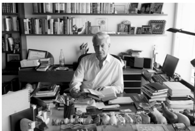
Vargas Llosa en su estudio limeño

Veinte novelas y un libro de memorias con estructura novelística, El pez en el agua , donde alterna en vertiginoso ritmo episodios de su infancia y juventud con la aventura electoral que protagonizó a fines de los años 80, dan sobrada cuenta de lo señalado por Cercas. Una legión de críticos, entre los que sobresale por su perspicacia Efraín Kristal, ha analizado y desmenuzado ese asombroso conjunto narrativo. El Perú -con sus dramas y su sorprendente diversidad, que se va atando y transformando entre las rasgadas y las efervescencias de una dilatada historia- está en el centro de esa parte fundamental de su escritura, caracterizada por una soberbia destreza en el arte de narrar, hurgando sin tregua en la médula inflamada de lo humano. Pero no solo el Perú ha alimentado la combustión de una creatividad prodigiosamente dotada para elaborar ficciones, esa «verdad de las men-