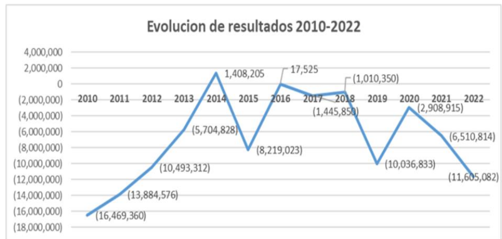
Gráfico N°1 Evolución de la pérdida Operativa.