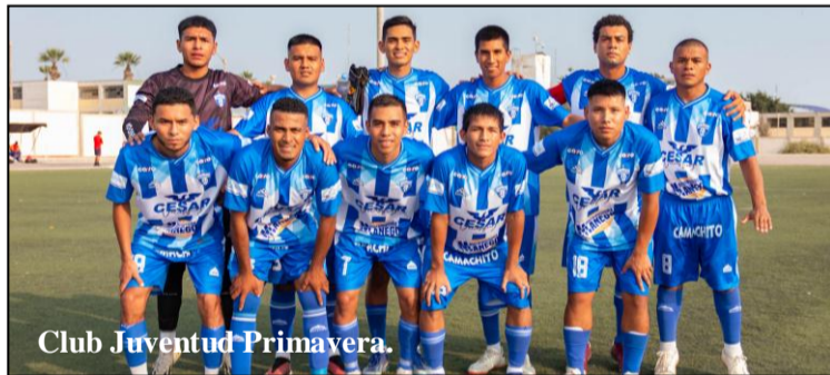
Club Juventud Primavera.

En el primero encuentro el cuadro de Santa Rita goleó por 3 a 2 a Alianza Progreso y en el partido de Fondo el cuadro de Asociación Cultural se coronó campeón al golear por 4 a 0 al cuadro de Parada de los Amigos.