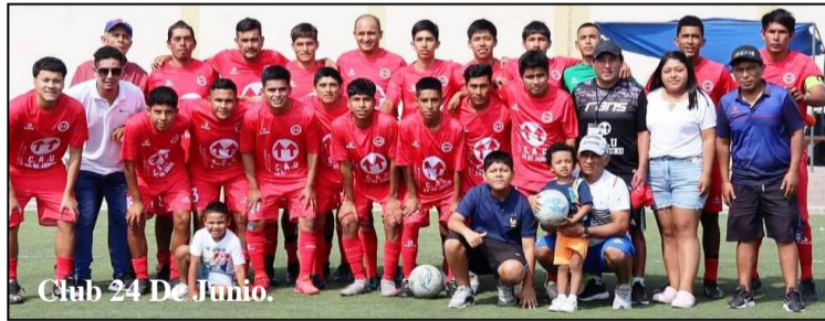
Club 24 De Junio.