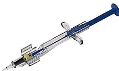
Figura 2: Sistema precargado (No incluye diseño)