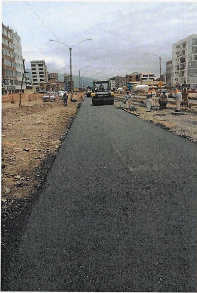
Colocacion de carpeta asfaltica

Continuar con las reuniones y mesas de trabajo con la Empresa Contratista y el Consorcio Supervisor a fin de que se aperturen frentes de trabajo y ya se pavimente la obra