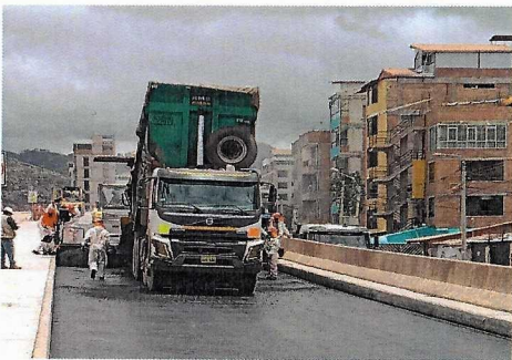
Colocacion de asfalto