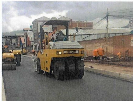
Colocacion de asfalto