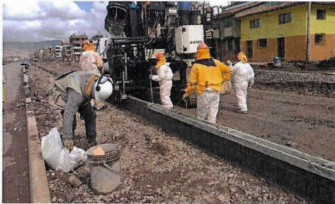
Construccion de sardineles:

Continuar con las reuniones y mesas de trabajo con la Empresa Contratista y el Consorcio Supervisor a fin de que se aperturen frentes de trabajo y ya se pavimente la obra