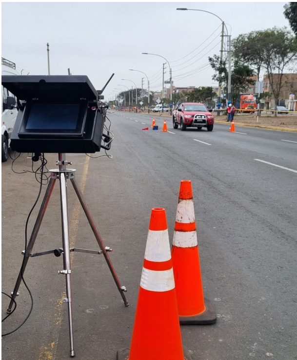
ILUSTRACIÓN DEL MEDIDOR DE VELOCIDAD PORTÁTIL CON NÚMERO DE SERIE R08081