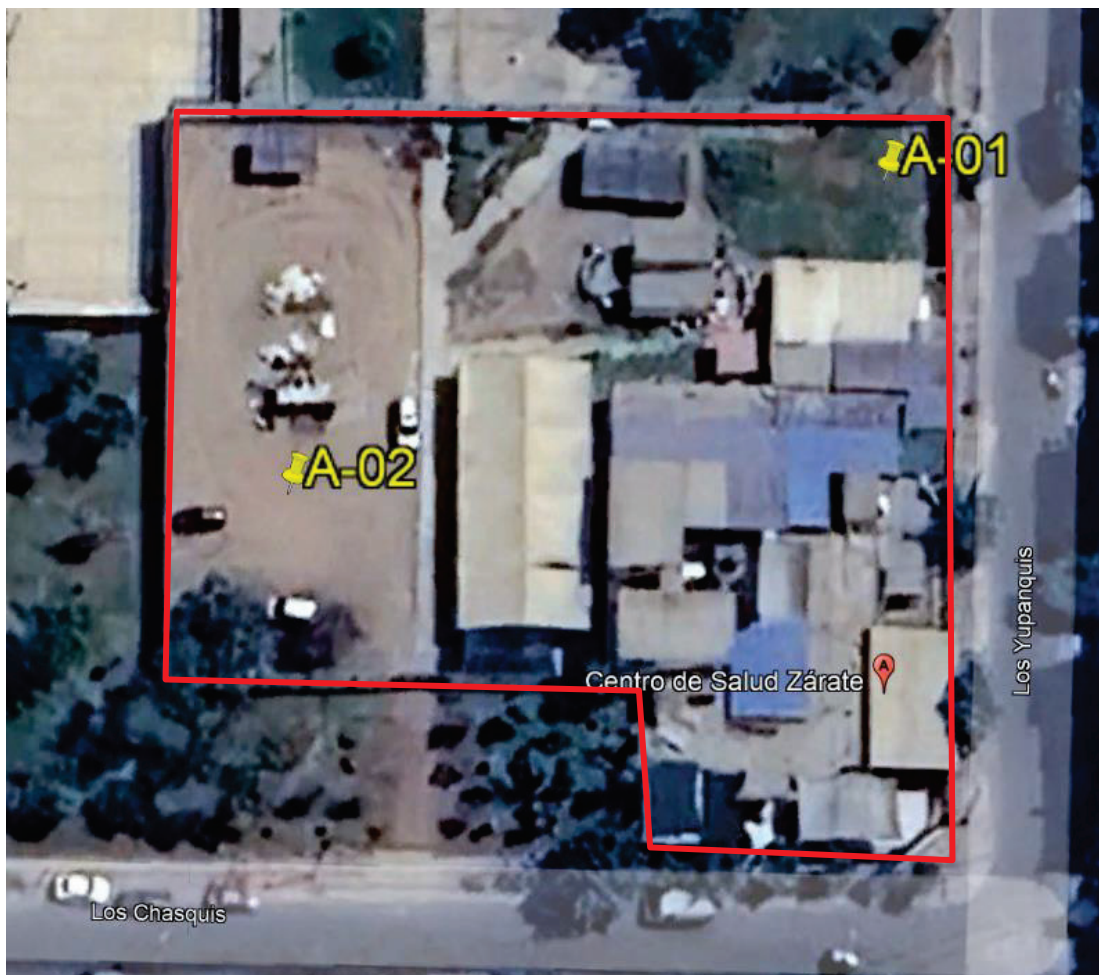
Imagen 5-01 Ubicación de los puntos de Monitoreo de Aire en el terreno para el Nuevo Centro de Salud Zárate