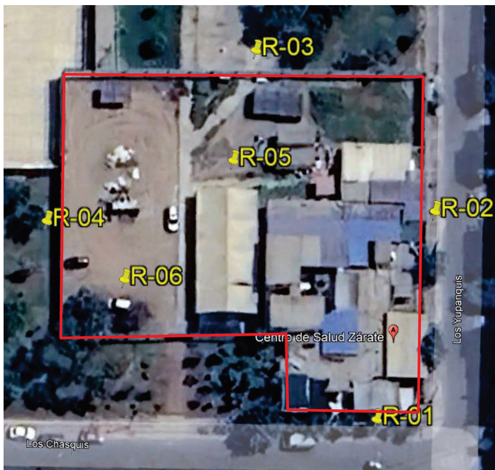
Imagen 5-02 Ubicación de los puntos de Monitoreo de Ruido en el terreno para el Nuevo Centro de Salud Zárate

"Decenio de la Igualdad de Oportunidades para Mujeres y Hombres" "Año del Bicentenario, de la consolidación de nuestra Independencia, y de la conmemoración de las heroicas batallas de Junín y Ayacucho"