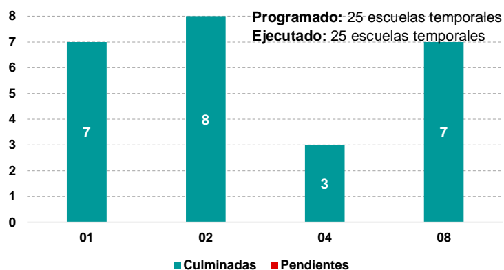
Gráfico N° 02: Escuelas de Contingencia implementadas por paquete en el 2024