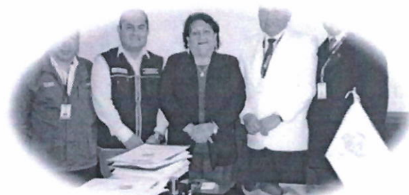
Instituto materno Perinatal y Diris Lima Centro firman convenio de cooperación interinstitucional