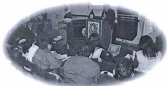
Refuerzan el trabajo de prevención en mortalidad materna y perinatal