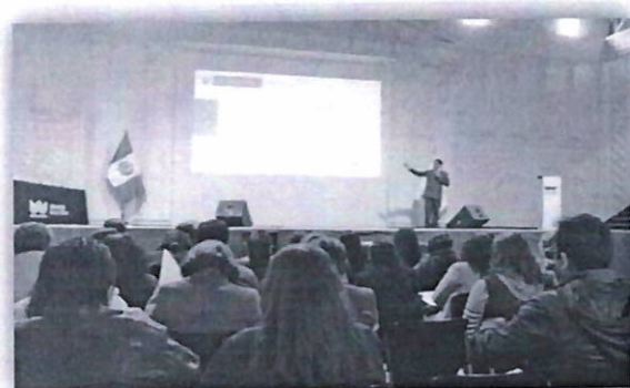
Personal de Establecimientos de Salud recibieron capacitación por especialista de Servir