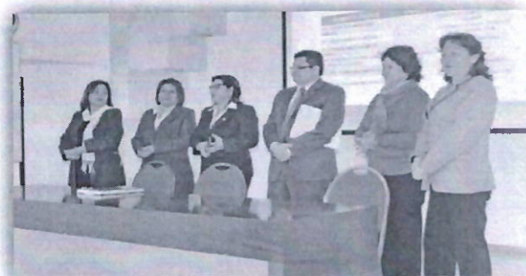
DIRIS Lima Centro refuerza las competencias y capacidades del personal