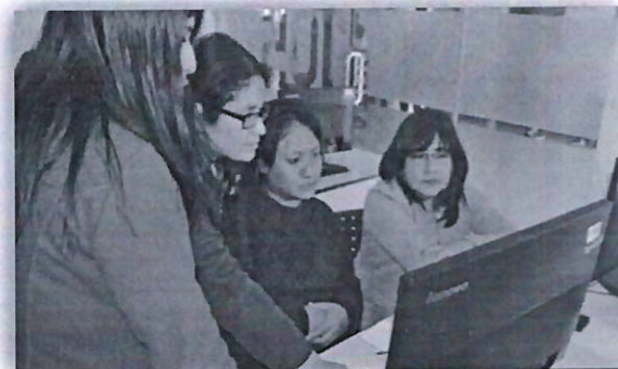
Más EE.SS de la DIRIS Lima Centro cuentan con Historias Clínicas Electrónicas