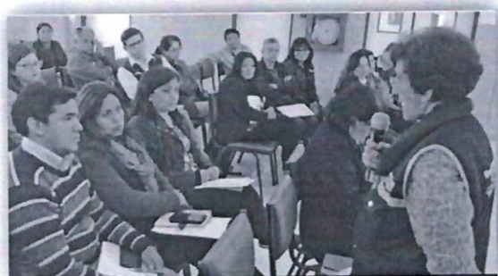
Directora de DIRIS Lima Centro informa a médicos jefes sobre gestión y plan de emergencia