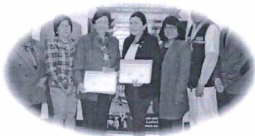
DIRIS Lima Centro genera alianzas con instituciones en la lucha contra la anemia