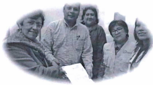
CERITS Caja de Agua recibe donación de material clínico y de escritorio