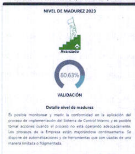
Gráfico N° 1 Nivel de Madurez (SISMAD) 2023

SERPOST S.A ha obtenido un nivel de cumplimiento del Sistema de Control Interno (SCI) de 80.63% al cierre del ejercicio 2023, lo que representa un nivel de madurez "Avanzado" Fuente: Oficio SIED N°0012-2024-OGR-FONAFE, de fecha 10.04.2024 (Ver Gráfico N° 1 y Tabla N° 1).