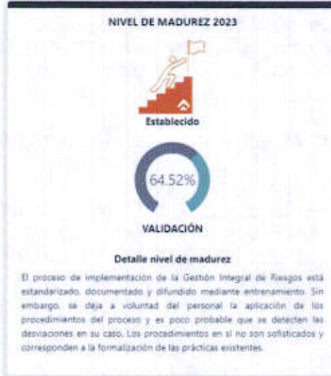
Gráfico N° 2 Nivel de Madurez (SISMAD) 2023

SERPOST S.A ha obtenido un nivel de cumplimiento de la Gestión Integral de Riesgos (GIR) de 64.52% al cierre del ejercicio 2023, lo que representa un nivel de madurez "Establecido" Fuente: Oficio SIED N°0012-2024-OGR-FONAFE, de fecha 10.04.2024 (Ver Gráfico N° 2 y Tabla N° 2).