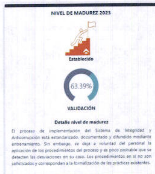
Gráfico 3 Nivel de Madurez 2023 - SISMA D

SERPOST S.A ha obtenido un nivel de cumplimiento del Sistema de Integridad y Anticorrupción de 63.39% al cierre del ejercicio 2023, lo que representa un nivel de madurez "Establecido" Fuente: Oficio SIED N°0012-2024-OGR-FONAFE, de fecha 10.05.2024 (Ver Gráfico N°3 y Tabla N°3).