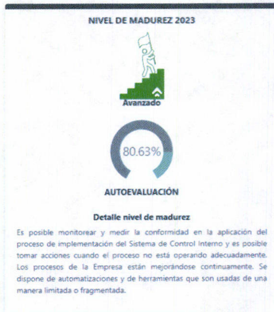
Gráfico N° 1 Nivel de Madurez (SISMAD) 2023