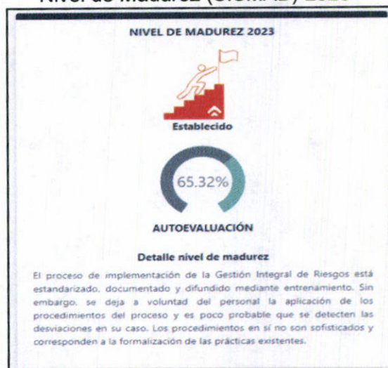
Gráfico N° 1 Nivel de Madurez (SISMAD) 2023

Al cierre del ejercicio 2023, el resultado de la autoevaluación de la GIR obtenida con la Herramienta Integrada (SISMAD – FONAFE) fue de 65.32%, equivalente a un Nivel de madurez “Establecido” (ver Gráfico N° 1 y Tabla N° 1).