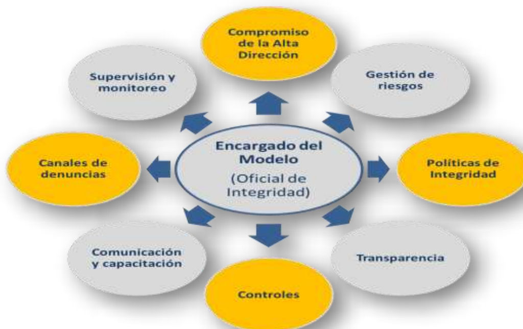
Gráfico N° 01: Modelo de Integridad