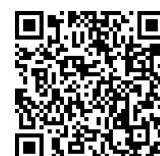
Fuente: Informe SISESAT