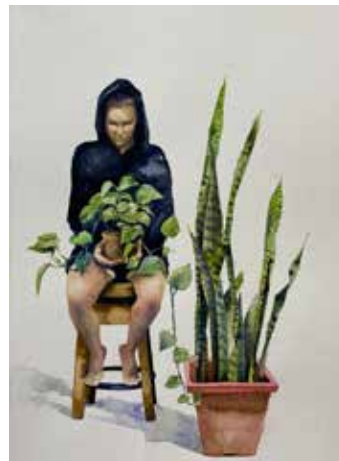
Juego y desvelos . Acuarela, 2024

El pintor Toto Fernández Ampuero (Lima, 1971) ha inaugurado una nueva muestra individual en La Galería, en el distrito limeño de San Isidro. La exposición lleva por título El Evangelio según Prometeo y busca ofrecer, en una serie de óleos y acuarelas a las que añaden un par de figuras escultóricas, una relectura contemporánea del