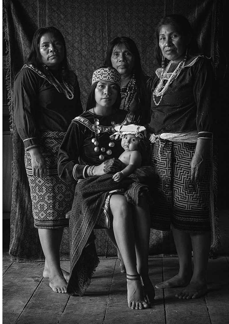
Mujeres y bebé con bwetaneti. Yarinacocha, Ucayali, 2022