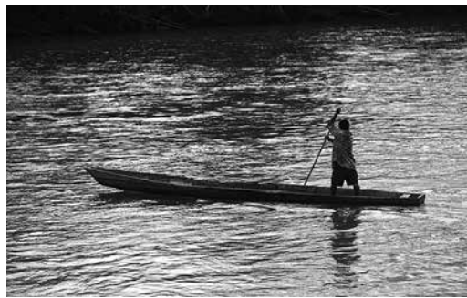
Poblador de Santa Rosa de Aguaytía, cruzando el río Ucayali, 2022