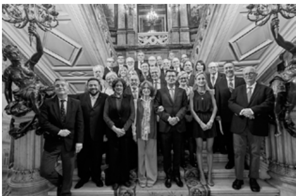
Historiadores y organizadores en la Casa de América de Madrid