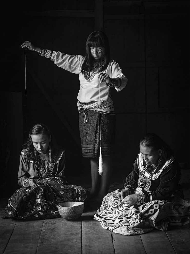
Hilando algodón y bordando. Yarinacocha, Ucayali, 2022