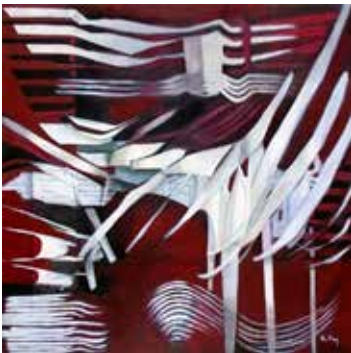
Serie Variaciones, óleo, 2006