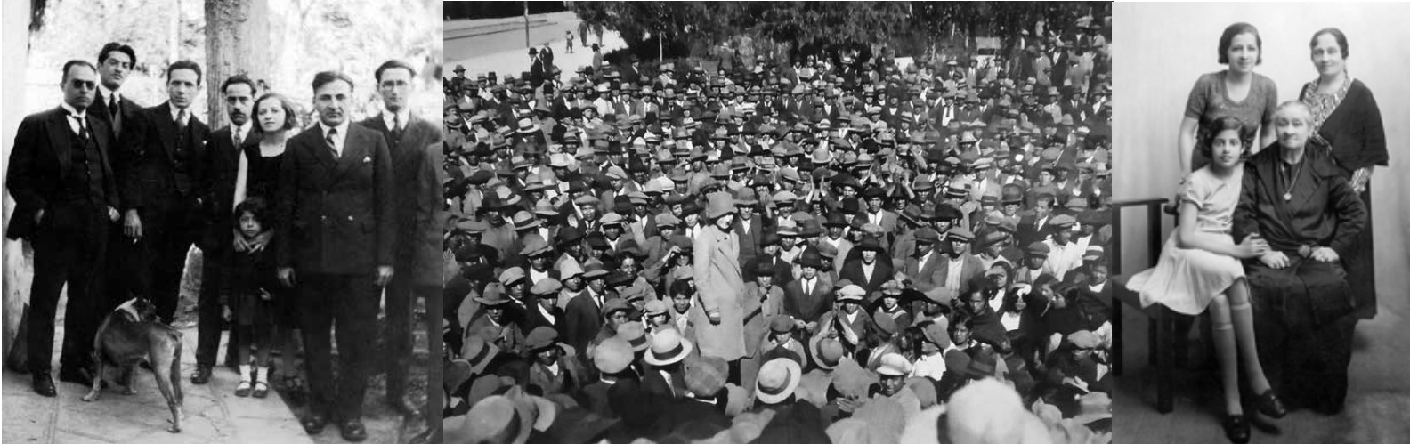
Con Haya de la Torre y otros apristas, México, 1928. Al centro: mitin en el Cuzco, 1933. A la derecha: con su madre, abuela e hija, Lima, 1934