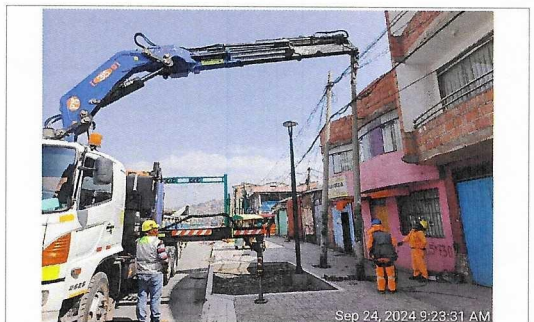
Retiro de postes, prog. 5+730 lado izquierdo.