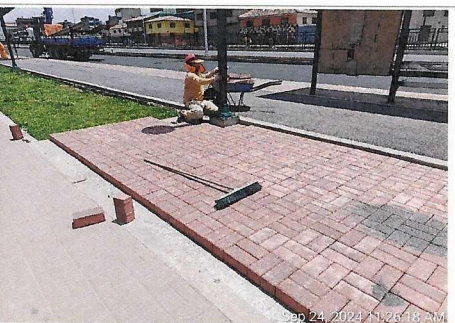
Trabajos de adoquinado en zona de mini gimnasio y parklet, prog. 3+530 - 3+540 lado derecho.