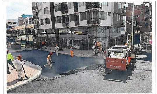
Colocado de MAD en vías transversales de la Urb Kennedy.