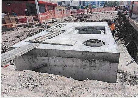
Desenfofrado en cámara de purga parte superior Óvalo Enaco.