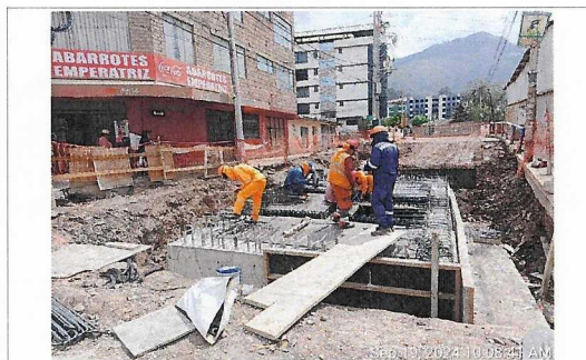
Armado de acero en losa de cámara de purga en Óvalo Enaco, prog. 5+160.