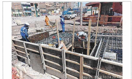
Encofrado y colocado de marco para tapas de cámara de purga.