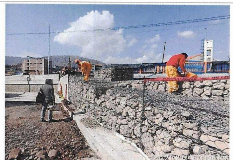
Colocado de malla para gaviones en vía expresa sur - Pte. Costanera I, prog. 6+170 lado izquierdo.