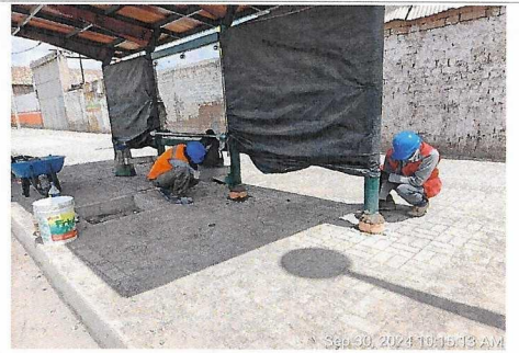
Concreto en bases de parantes de paradero, prog. 4+660 lado izquierdo.