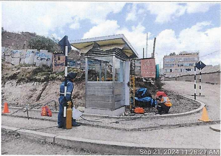
Trabajos en caseta de guardiania, prog. 4+720 lado derecho.