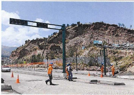
Izado de postes semafóricos en Óvalo Cerrito Retamal 4+720 ambos lados.