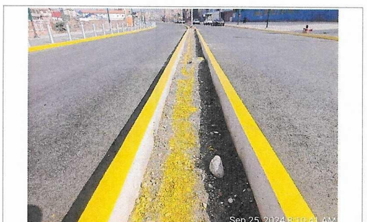
Pintado de sardineles con pintura de tráfico en berma y costados, prog. 6+180 - 6+870.