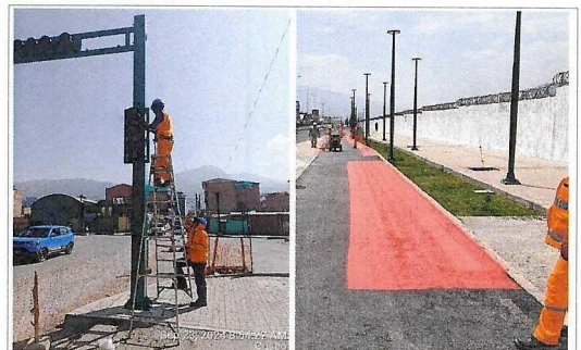
Instalación de semáforos en Óvalo Túpac Amaru, prog. 5+720 ambos lados. Ensayo y prueba de pintado de Ciclovia.