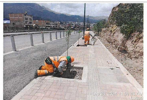
Trabajos de plantío en jardineras al costado de Cerrito Retamal, prog. 4+700 - 4+800 lado derecho.