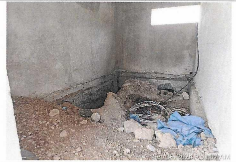
Trabajos de excavación de interiores de subestación eléctrica, prog. 5+200 lado derecho.