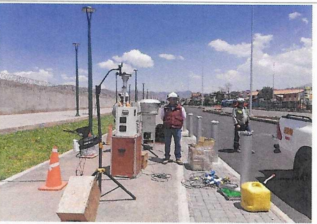
Monitoreo de aire en prog. 4+000.