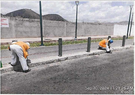
Pintado de bolardos con base zincromato, prog. 3+100 - 3+150 lado derecho.