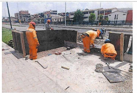
Encofrado de banca de parklet, prog. 3+720 lado derecho.