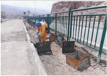
Encofrado de bases para rejas metálicas en berma central, prog. 4+800 - 4+830.