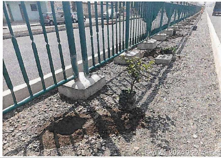
Trabajos de plantío en berma central, prog. 5+200 - 5+400 eje.