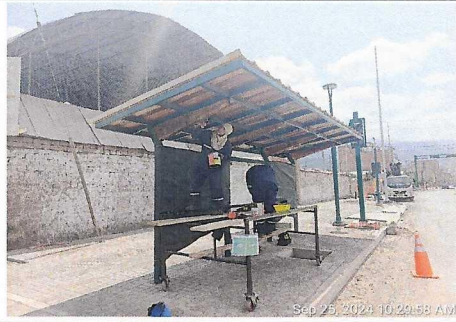
Trabajos de techo de paradero, prog. 4+680 lado izquierdo.