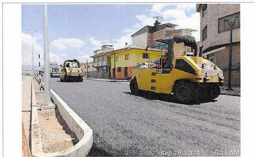
Pavimentado última capa MAD en vía lateral, prog. 3+300 - 3+600.