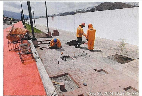
Trabajos en mini gimnasio y parklet int. con av. República de Chile.