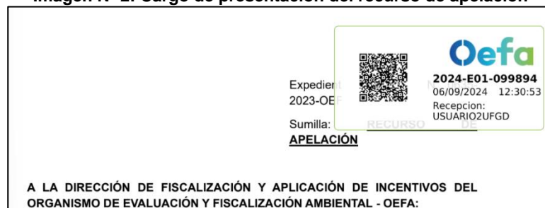
Imagen N° 2: Cargo de presentación del recurso de apelación