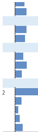
CUADRO N° 01 REGIÓN ICA: TRABAJADORES CON DISCAPACIDAD EN EL SECTOR FORMAL PRIVADO, SEGÚN PRINCIPALES CARACTERÍSTICAS, OCTUBRE 2022 Y OCTUBRE 2023 (Absoluto y porcentaje)

Nota La información de trabajadores se refiere a puestos de trabajo. La variación anual se refiere a la variación porcentual del empleo en el mes indicado respecto al mismo mes del año anterior.