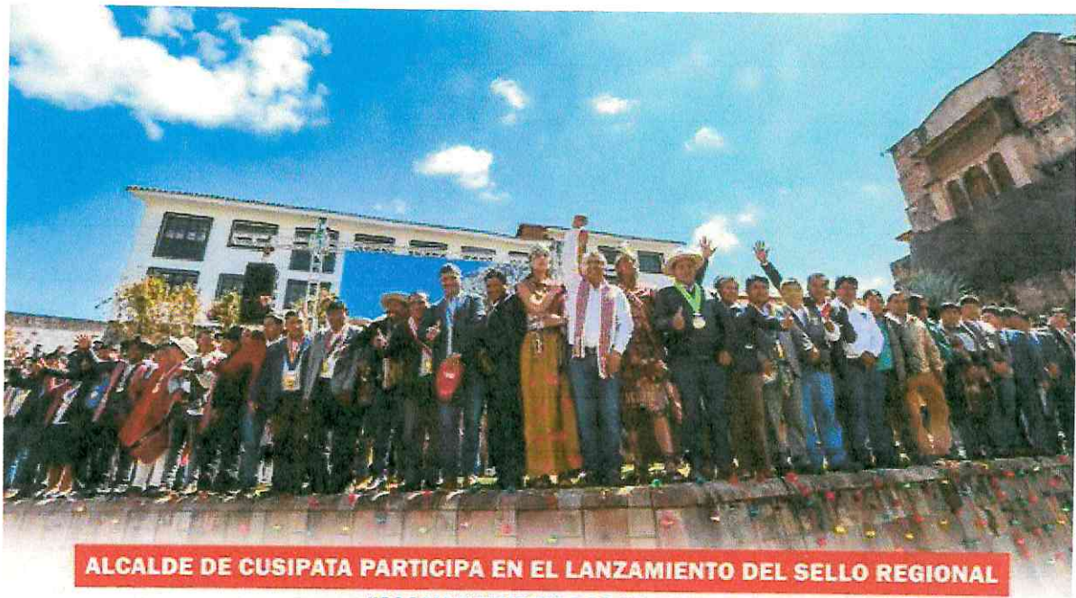
ALCALDE DE CUSIPATA PARTICIPA EN EL LANZAMIENTO DEL SELLO REGIONAL "ALLIN KAWSAY 2024"

El evento se desarrolló ayer, en la explanada de Qoricancha y contó con la presencia del Gobernador Regional de Cusco, Ing. Werner Salcedo, así como alcaldes provinciales y distritales de la región. Durante la ceremonia, se anunció que el monto designado para este año para las municipalidades ganadores es de s/35,000,000.00 (Treinta y cinco millones 00/100 soles).