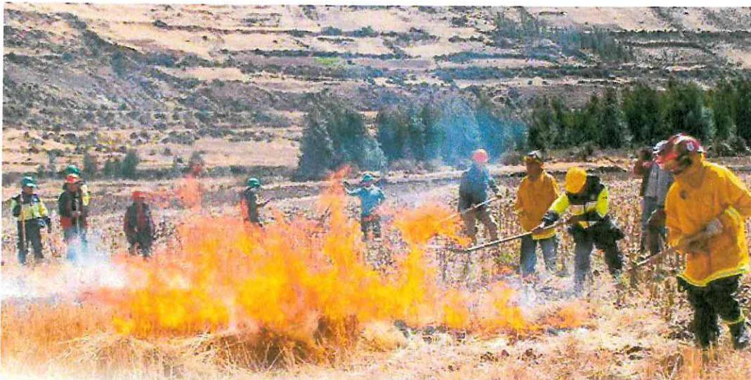
CONFORMACIÓN Y CAPACITACIÓN A BRIGADAS EN PREVENCIÓN DE INCENDIOS FORESTALES.

👉 La actividad se desarrolló hoy 12 de agosto, y fue organizada por la Oficina de Defensa Civil y el Proyecto de Forestación de la Municipalidad Distrital de Cusipata.