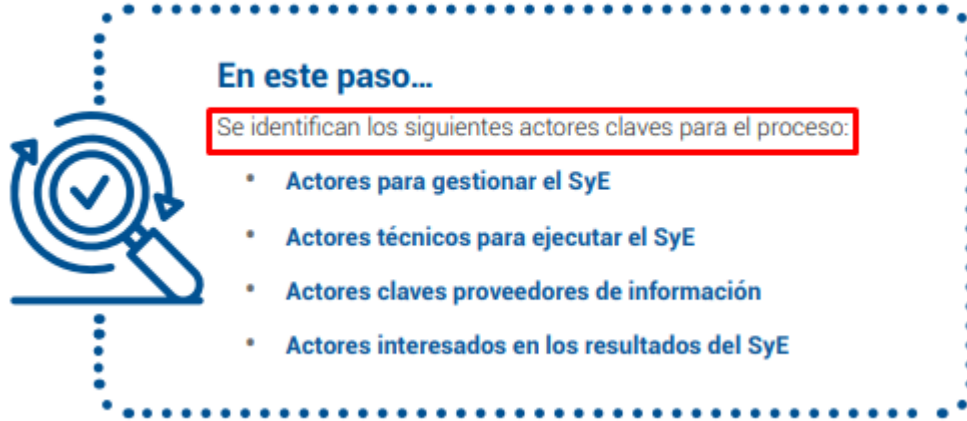
Figura 4. Pasos del seguimiento de políticas y planes

SINAPLAN (Directiva N° 001-2024-CEPLAN/PCD). Donde en la etapa preparatoria, ver figuras siguientes: