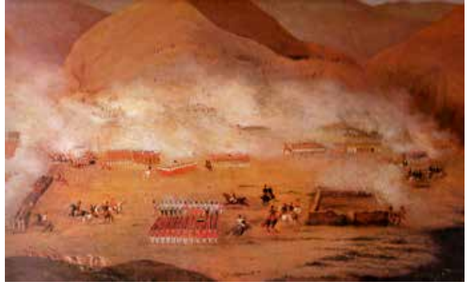
Martín Tovar, Batalla de Ayacucho , 1902. Galería Nacional, Caracas. Derecha: Anónimo, Batalla de Ayacucho , ca. 1830. Museo Nacional de Historia, Lima. En la portada: Daniel Hernández, Capitulación de Ayacucho , 1924. Museo del BCR, Lima