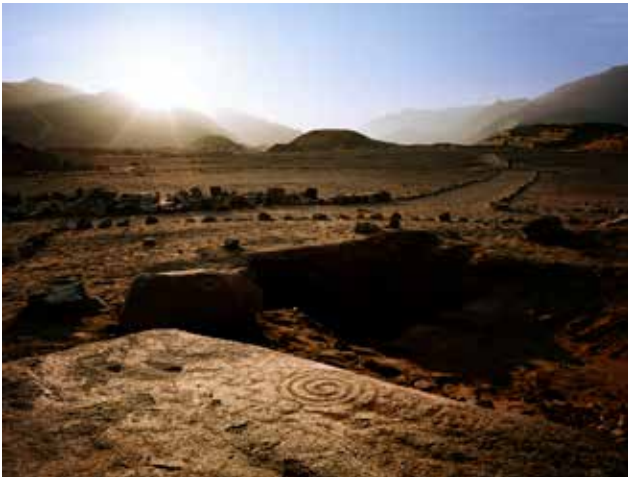
Incisión en espiral en el altar al pie de la Galería Pirámide