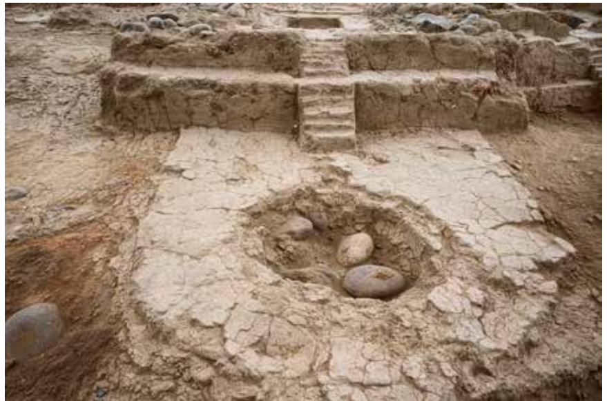
Maqueta arquitectónica en El Molino