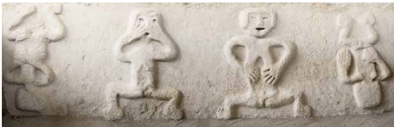
Friso en una pirámide de Vichama

En la portada: Pirámide Mayor de Caral en el valle de Supe