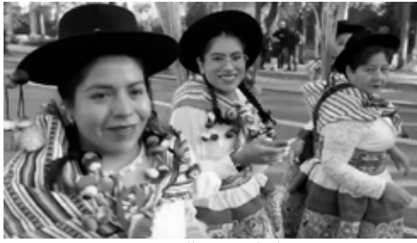
Pasacalle en Madrid