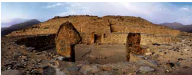
Monolitos al ingreso de la Plaza Circular en la Pirámide Mayor