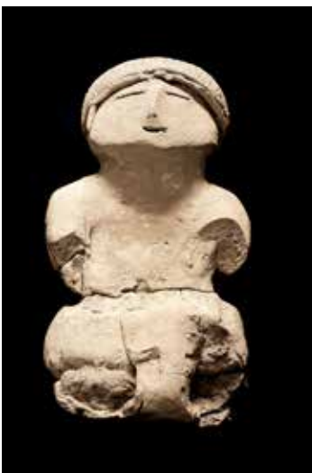
Figurilla de barro sin cocer