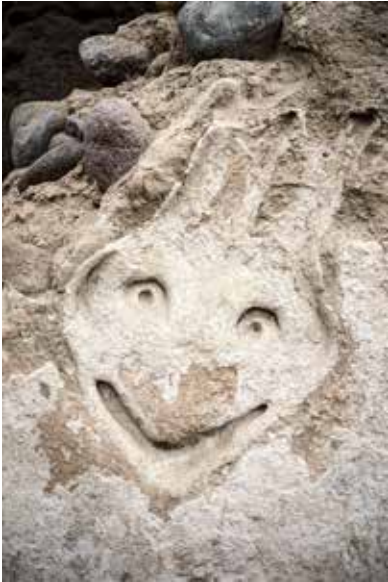
Piedra Parada. Friso de la serpiente de dos cabezas