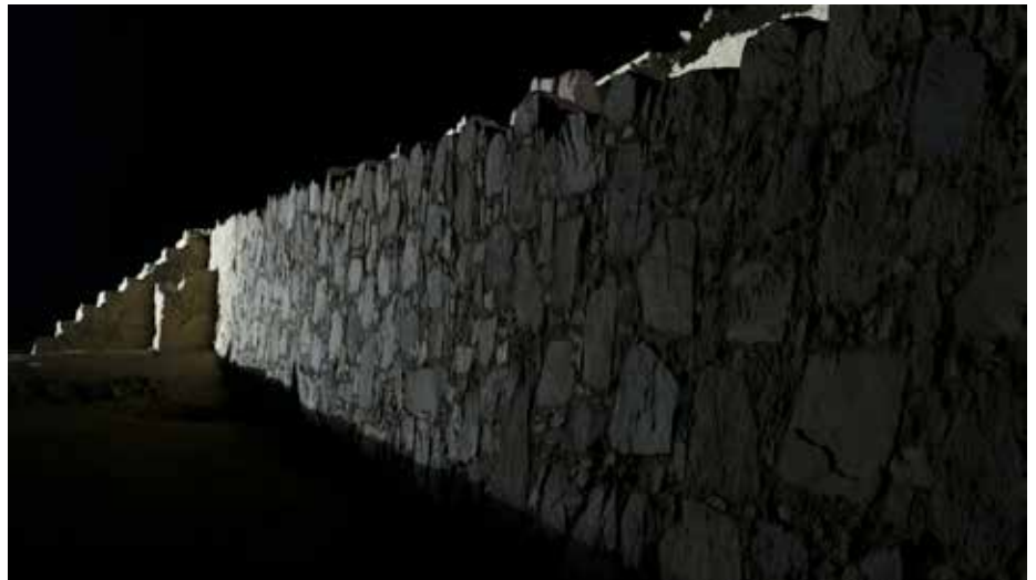
Pared inferior de la Galería de la Pirámide, orientada hacia el mar