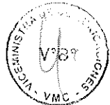
..... CARLOS LOZADA CONTRERAS Ministro de Transportes y Comunicaciones