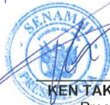
KEN TAKAHASHI GUEVARA Presidente Ejecutivo Servicio Nacional de Meteorología e Hidrología del Perú