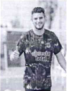
Defensor se muestra feliz.

"Ojalá se concrete. De verdad que sería un gran refuerzo para nosotros. Aunque él es hincha de la 'U', lo vamos a recibir bien en casa", dijo el León durante la transmisión en un evento deportivo organizado por algunos streamers, en el