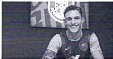
FIRMA. Tendrá su primera experiencia en el fútbol inglés.

Pizarro, Miguel Mosto, Diego Penny, Paolo Hurtado, Cristian Benavente, André Carrillo, Rodrigo Vilca y Yuriel Celi. ♦