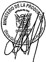
GLADYS TRIVEÑO CHAN JAN Ministra de la Producción