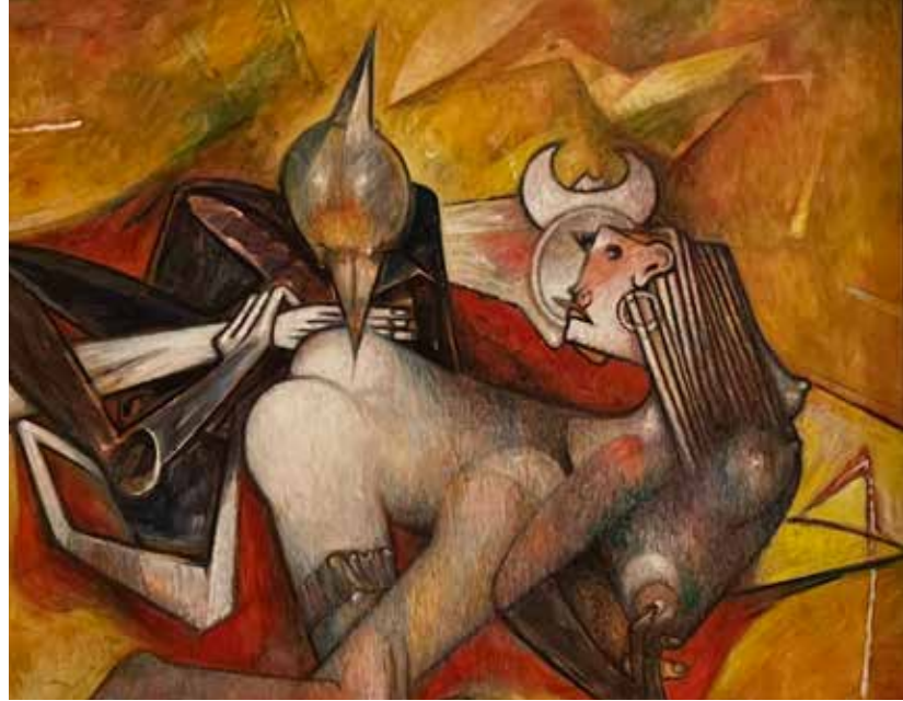
Gerardo Chávez. El pájaro de dos picos , 1990. Colección particular