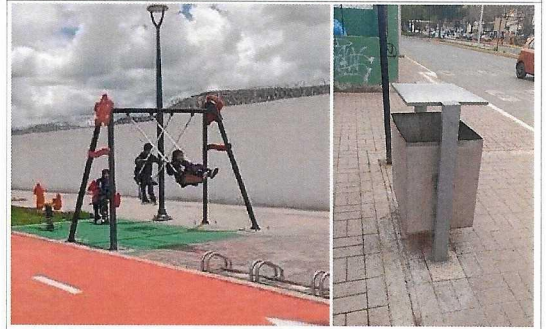
Instalación de áreas de recreación (juegos y mini gymnasios). Ciclovia bidireccional con 6.2 km de longitud.