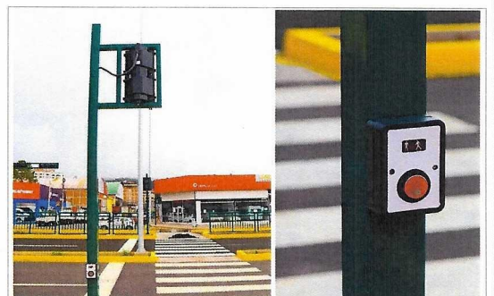
Instalación de los controles de excepción para cruces peatonales.

CONSEJO DE SUPERVISIÓN OFICIAL DE NOMINACIÓN Y SUPERVISIÓN