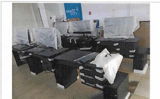
Instalación de terminales en el centro de control semafórico.